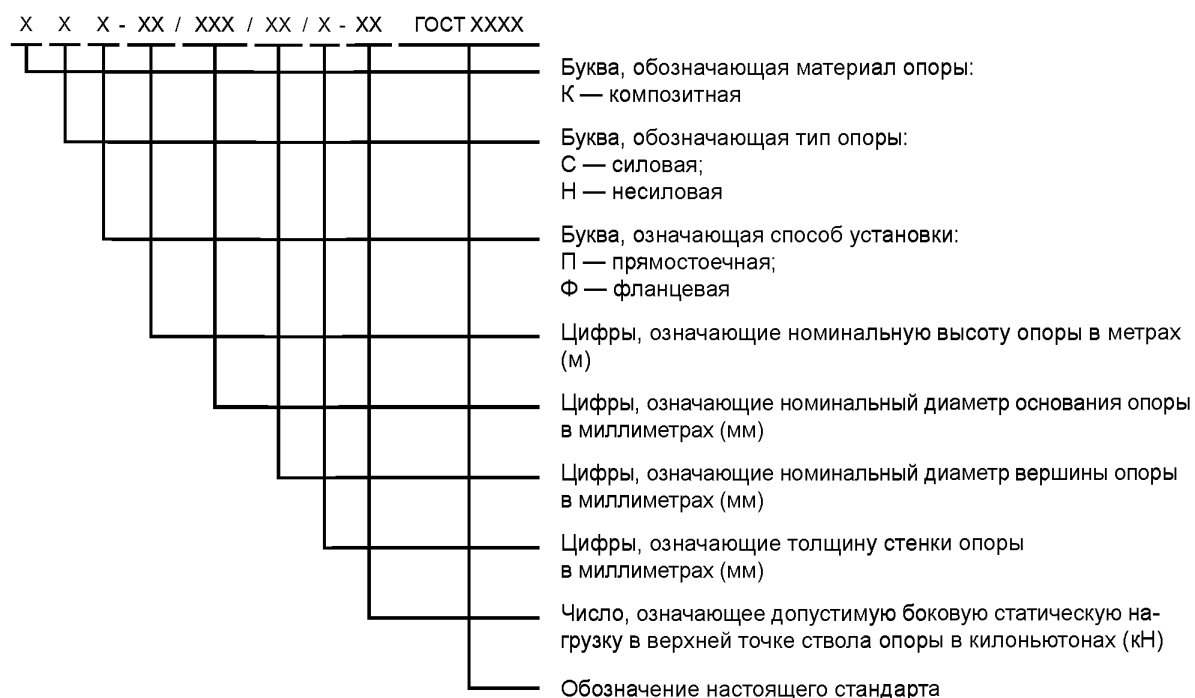
Рисунок 4.3 — Структурная схема маркировки композитных опор

4.3.3 Условное обозначение композитной опоры в технической документации и при заказе должно состоять из разделенных дефисами буквенно-цифровых групп, порядок и значения которых должны соответствовать схеме, приведенной на рисунке 4.3.